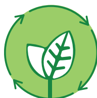
Contenuti di riciclati