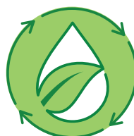
Consumo Idrico Ridotto