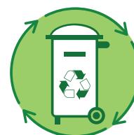
Riduzione dei rifiuti