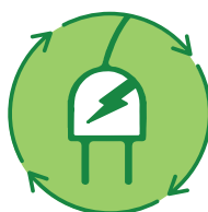
Consumo Energetico Ridotto